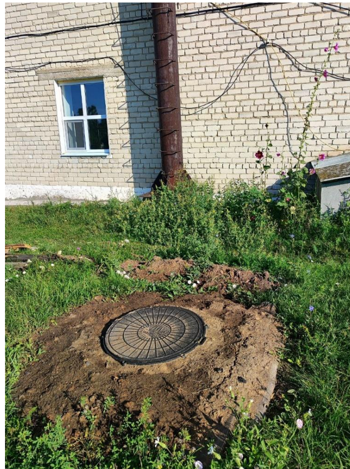
Фото после (люк водопровода)